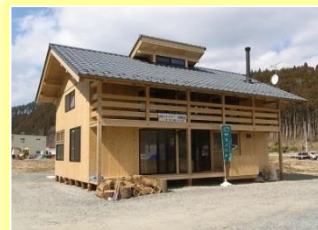
南三陸の取り組み事例

現在のエネルギー状況を説明後、ペレットや薪ストーブの暖房の紹介、地域の資源をいかした南三陸の復興住宅の事例紹介、省エネ設備などについて専門家から説明をします。