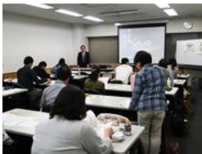
昨年の養成研修の様子