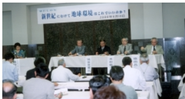
2000年度 MELON会員のつどい