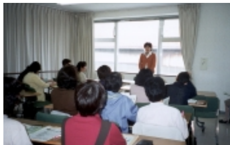
第1回環境市民講座

古川からの参加者は、「次は、ぜひ、古川でもやってほしい」、また、アンケートでは「地球温暖化は一人一人の行動がいかに大事かということが改めてわかった。」という感想が寄せられていました。