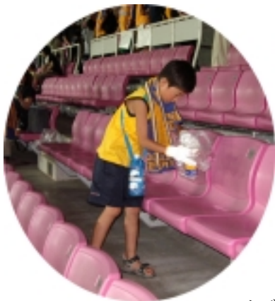
スタジアム清掃活動中

クルするためにのり状に溶かした紙の実物が出てくると子どもたちは興味津々で、熱心に耳を傾けていました。