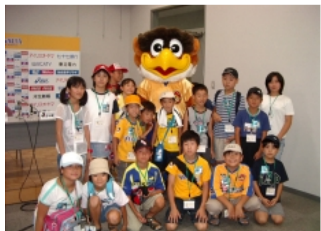
ベガッ太君と記念写真

ご協力いただきました関係者の皆さん、サポーターの皆さん、本当にありがとうございました。