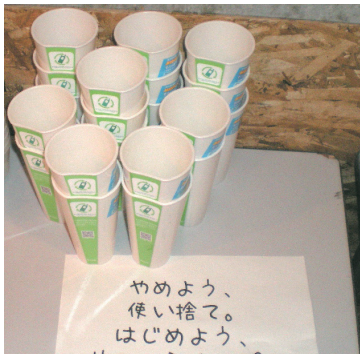
はじめようリユースカップ♪

Zepp Sendai はグリーン電力を採用しています。音と光は風のかでできています！