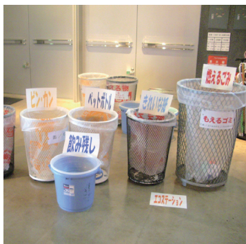
ごみはもちろん分別