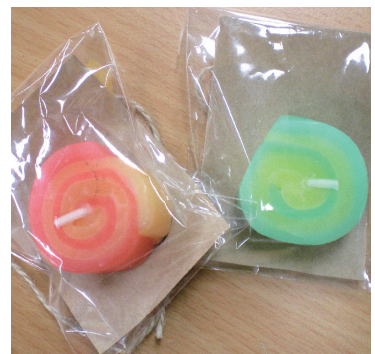
リメイクキャンドル

使用済みウェディングキャンドルを使用。2色のうずまき型はお菓子のようでかわいいと好評でした。