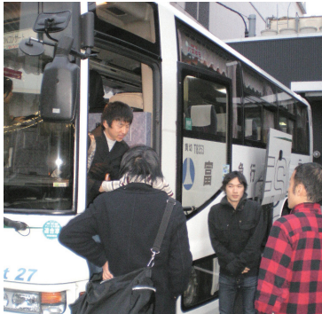
移動は BDF バス

出演アーティストと関係者の皆さんは使用済みの天ぷら油を燃料に走る BDF バスで東京から来仙。