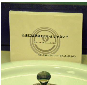
トイレに ECO メッセージ

「おひさまや」の協力による出演者・スタッフの夕食。出演者にも「すごくおいしかった！」と大好評♪