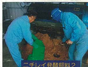
ニチレイ発酵飼料 2

今年度に入り、この取り組みを県南地区で循環できるよう、地元の加工連携と協力し、残渣を養豚飼料として利用、豚肉を工場で使うという仕組みを始めています。輸送エネルギーの削減・コスト削減の効果も十分発揮されています。