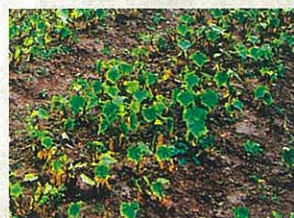
▶ヤトロファ・クルカス

原料も「ヤトロファ・クルカス」という植物で、不毛な土地でも育つ植物で、地球の緑化にもつながります。