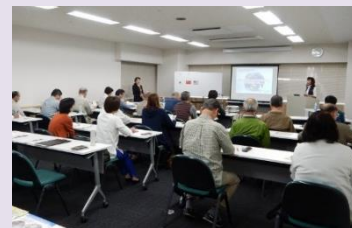
昨年の養成研修の様子