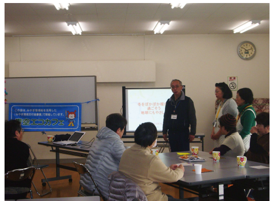
みなし仮設住宅住民対象の学習会

気仙沼市地球温暖化防止啓発事業にも参加しました。15か所の仮設住宅で「冬を暖かく過ごそう、地球にも優しく」のテーマで省エネや風呂敷活用術、保温調理など時に応じて、住民同士のコミュニケーションに力を委ねながら温暖化防止を訴え、実践に繋げることが出来ました。令和2年2月まで、活動は63回、参加人数1,083人に達しました。失われた町の原風景を心に刻み、この地の人々に寄り添い、活動が再開出来る日を待ち望んでいます。