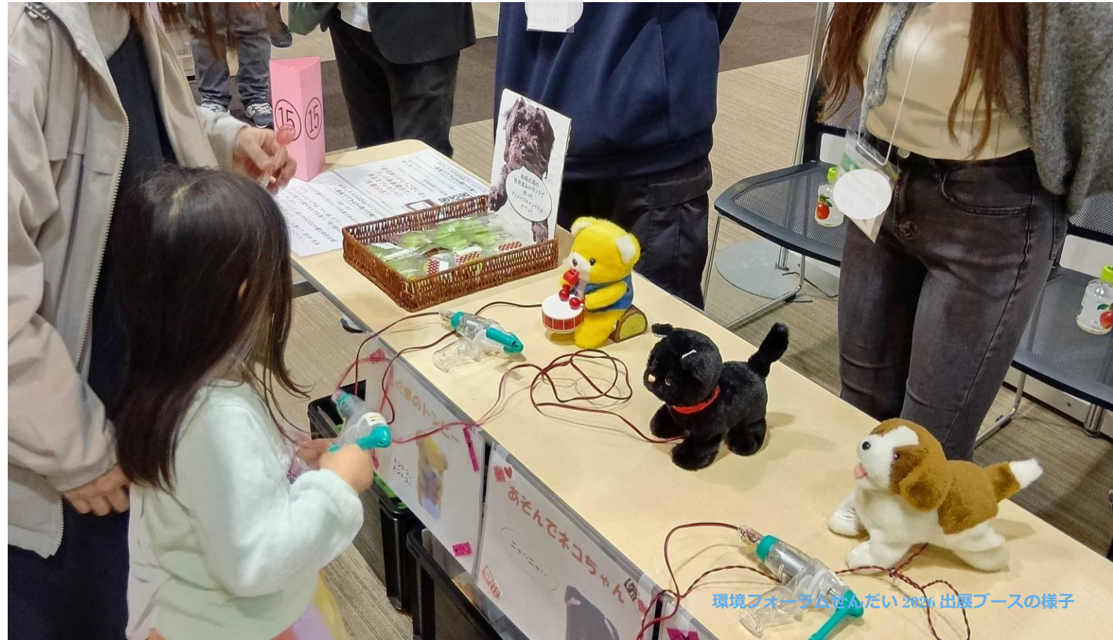
環境フォーラムせんだい 2026 出展ブースの様子